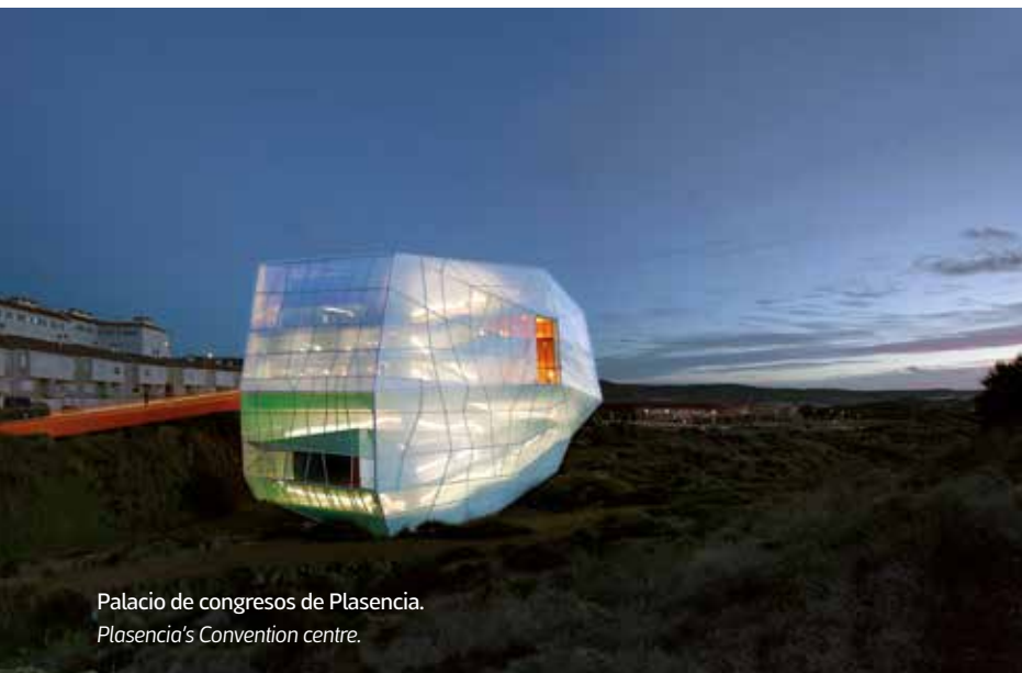
Palacio de congresos de Plasencia. Plasencia's Convention centre.

junio de 2017) y Villanueva de la Serena (abierto en noviembre de 2017); recintos feriales; organizadores de congresos; y empresas de actividades complementarias.