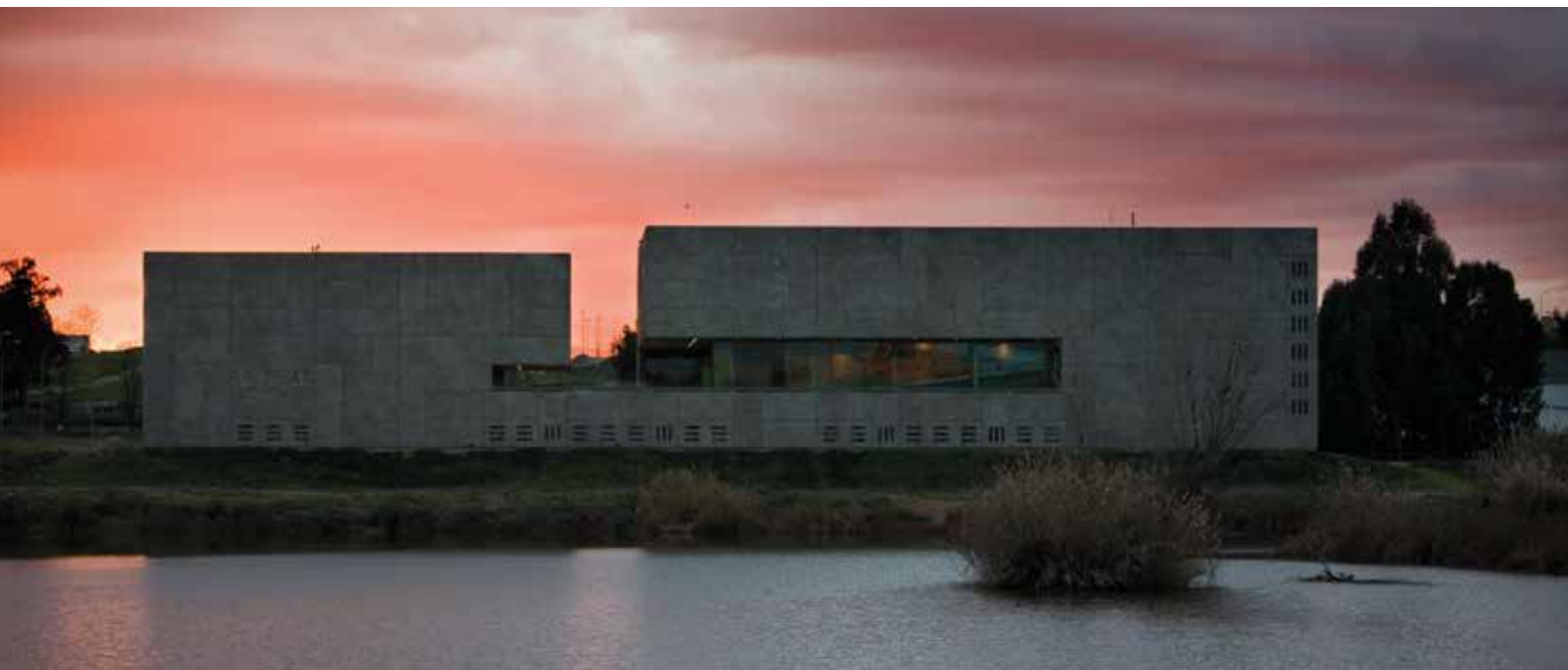
Palacio de congresos de Mérida. Mérida's Convention centre.