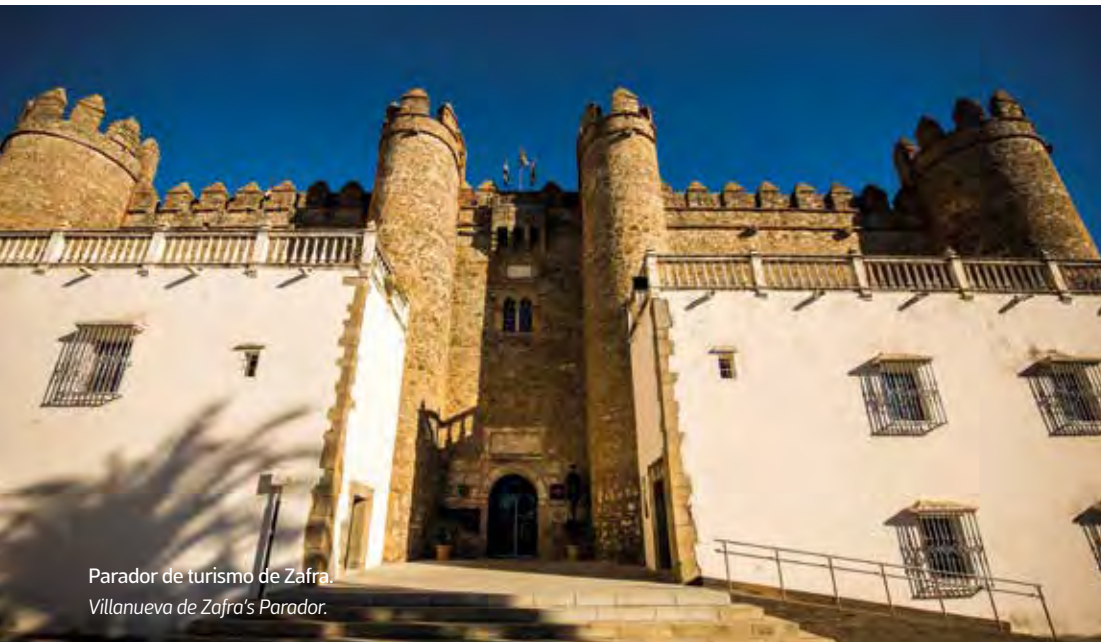
Parador de turismo de Zafra. Villanueva de Zafra's Parador.