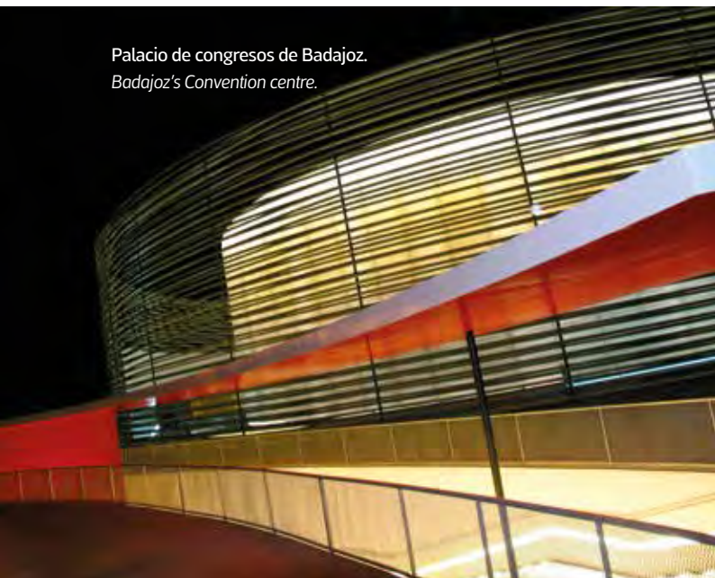
Palacio de congresos de Badajoz. Badajoz's Convention centre.