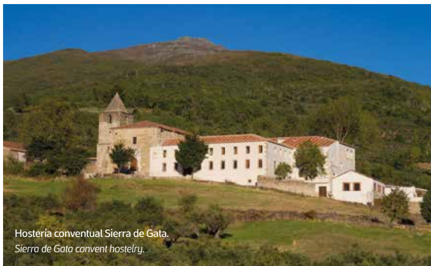
Hostería conventual Sierra de Gata. Sierra de Gata convent hostelry.

We recommend three activities regarding cheese, ham and bird-watching: fields in which Extremadura is a national and international powerhouse! The Ruta del Queso (Cheese Route) is composed of 76 public and private institutions offering a wide variety of activities: from cattle ranch visits to cheese making workshops (always accompanied by experts). There’s also an Iberian ham route: from the meadow to the table. Visit towns with long-established ham making tradition such as Montánchez, Fregenal de la Sierra, Jerez de los Caballeros, and Monesterio. Finally, there’s bird-watching: grab your binoculars and telescopes and watch eagles and vultures accompanied by one of the 80 members of Extremadura’s Birding Club.