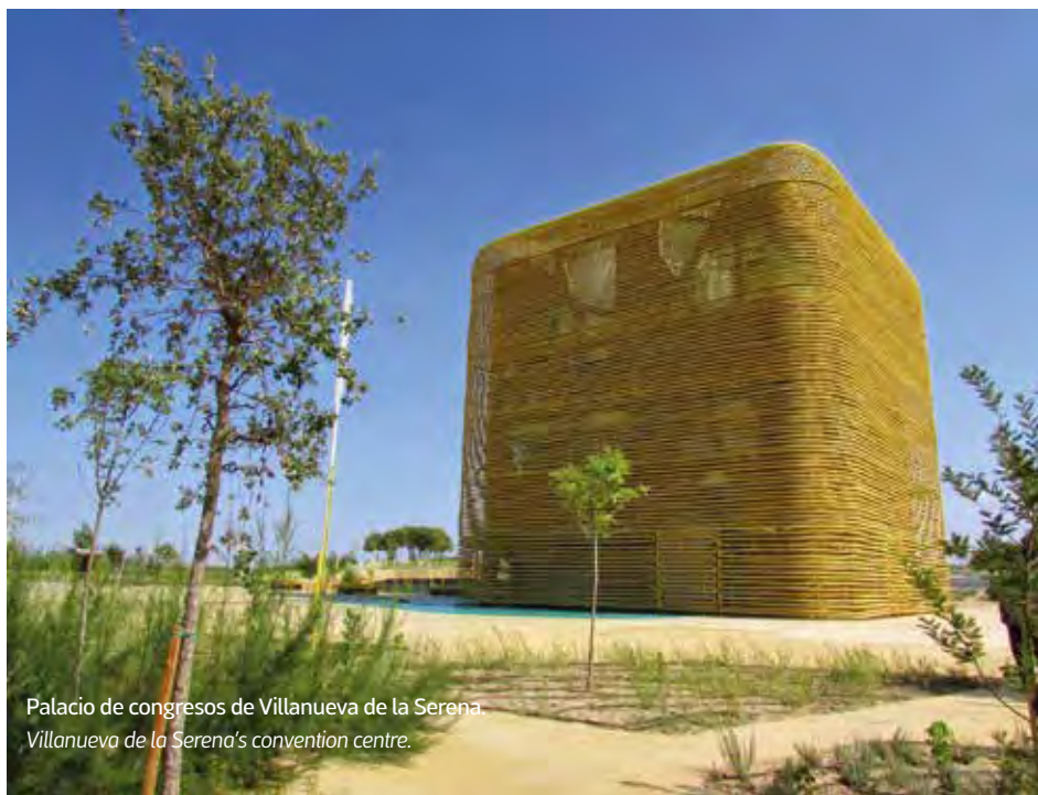
Palacio de congresos de Villanueva de la Serena. Villanueva de la Serena's convention centre.

Besides hotels capable of hosting corporate events all over the region, Extremadura has many unique spaces: manors, wine cellars, castles and even scientific institutions such as the Jesús Usón Minimally Invasive Surgery Centre in Cáceres. Other interesting hosting facilities include San Francisco Cultural Complex (located in a 15th Century convent) and Arguijuela Castle (Cáceres),