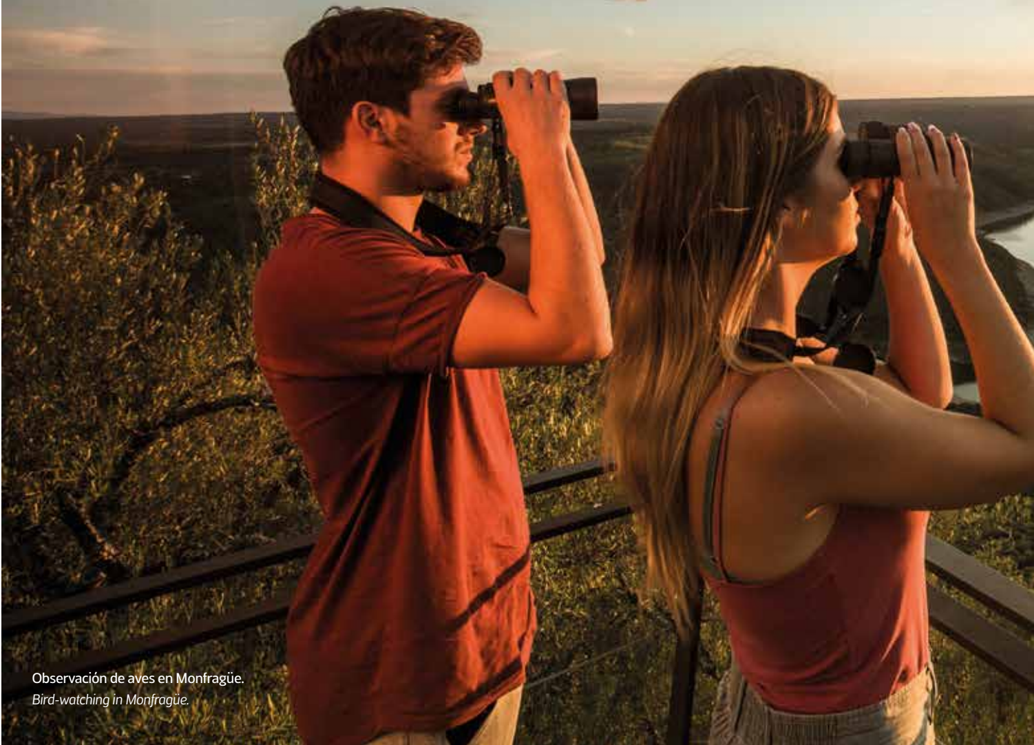
Observación de aves en Monfragüe. Bird-watching in Monfragüe.