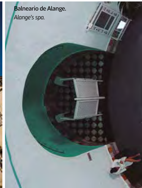
Balneario de Alange. Alange's spa.