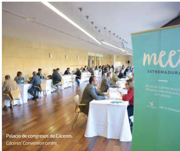
Palacio de congresos de Cáceres. Cáceres' Convention centre.

With modern conferential infrastructure and a combination of heritage, gastronomy and nature, Extremadura is a very attractive destination for professional meetings, corporate events and incentive travels.