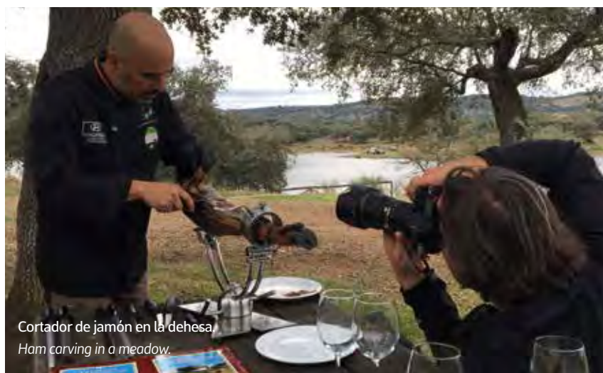
Cortador de jamón en la dehesa. Ham carving in a meadow.